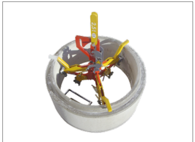
position SCHACHTIX sur rehausse de regard

La pince SCHACHTFIX peut être maniée au bout d'un crochet par une grue de camion ou de chantier, un pont roulant, une pelle mécanique ou un chariot élévateur.