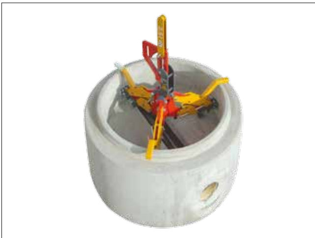
position SCHACHTIX sur fonds de regard