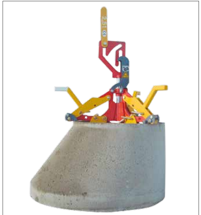
position SCHACHTIX sur cône