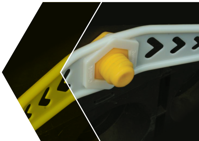
Clé plastique de 36 pour écrou d'échelon

L'échelon traversant à visser est destiné à fournir à tout opérateur un moyen d'accès vertical sur une paroi fine en souterrain. L'échelon est conçu pour être rapidement fixé à toute paroi fabriquée en atelier ou sur site en introduisant les embouts filetés au travers de trous préalablement percés et garantissant l'étanchéité grâce au serrage de deux écrous à l'extérieur de la cloison.